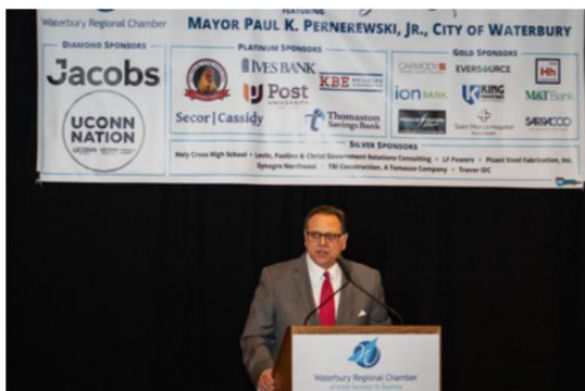
Almuerzo del alcalde Paul Pernerewski 2026